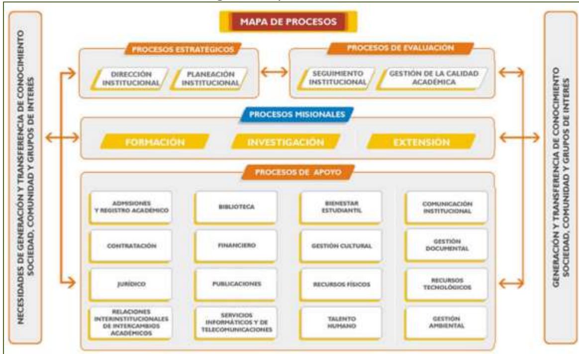
Imagen 1. Mapa de Procesos UIS

Para la validación del estado de los Mapas de Riesgos a 30 de junio de 2016, se tomó como base el modelo de operación por procesos de la Universidad.