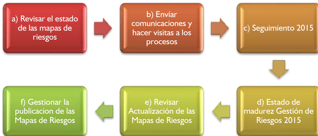
Gráfica 1. Metodología de para Realizar el Seguimiento

El seguimiento a los Mapas de Riesgos por proceso se realizó con la siguiente metodología;