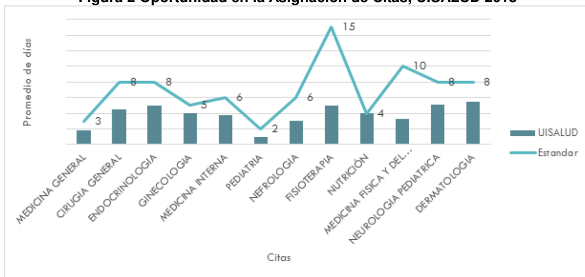
Figura 2 Oportunidad en la Asignación de Citas, UISALUD 2018