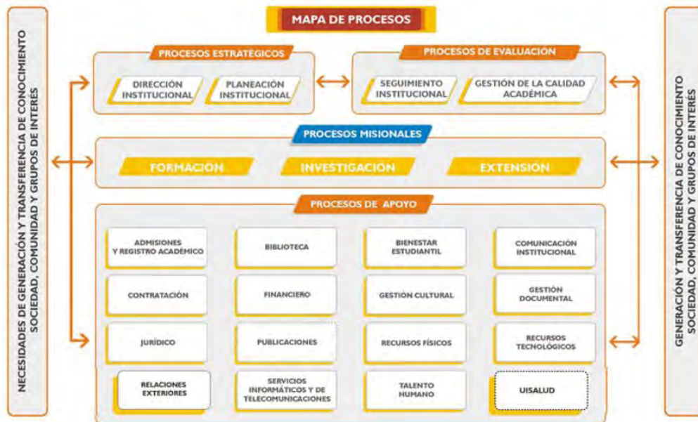
Figura 2. Mapa de Procesos

Adicionalmente, la Universidad Industrial de Santander está organizada por procesos: de apoyo, misionales, estratégicos y de evaluación.