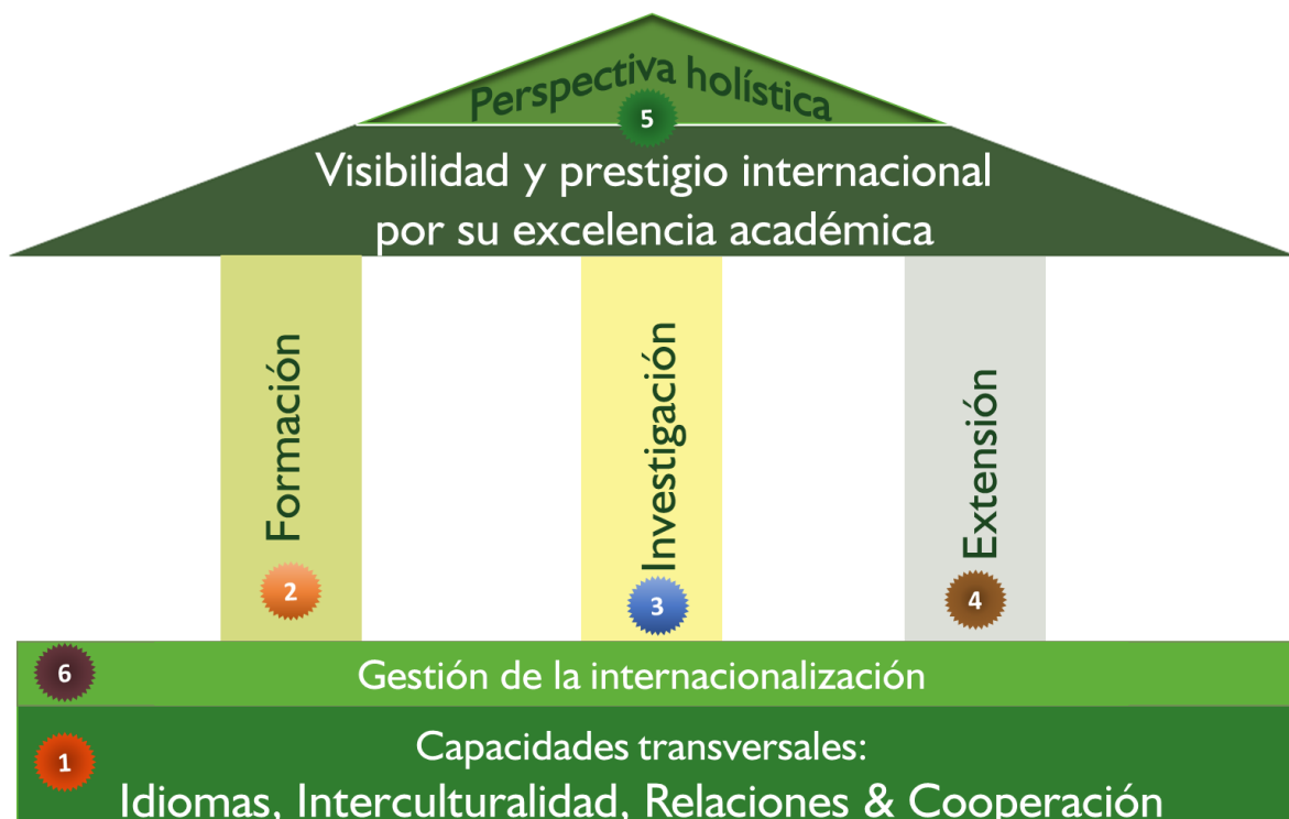
Figura 3. Elementos más relevantes del esquema de internacionalización en la UIS

En conjunto, estos elementos conducen a una perspectiva holística, tanto en la universidad como en cada uno de los miembros de la comunidad universitaria, y, en consecuencia, generan visibilidad. El resultado esperado en la articulación de los factores mencionados anteriormente es el reflejo de una institución visible y con prestigio, en la que las acciones integradas de manera natural darán cuenta de una reputación y reconocimiento positivo ante sus pares en el extranjero. Sin embargo, debajo de eso, está lo que lo hace posible. Si este esquema fuera un iceberg, la parte visible sería una universidad que tiene, junto con sus miembros, una perspectiva holística, aunada a una imagen institucional con una visibilidad y prestigio internacional, fruto del cumplimiento de sus labores misionales, pero que esta soportada por una gran masa que mediante un esfuerzo colectivo logra este propósito.