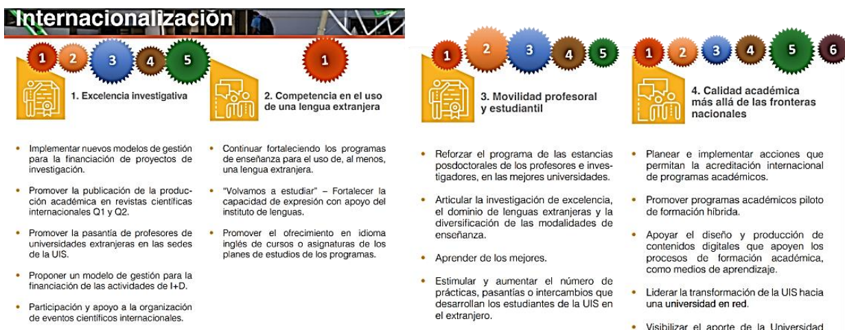
Figura 5. Relación entre el Plan de Gestión Rectoral y el esquema de internacionalización en la UIS

Tal como se observa en la figura 5, los diversos elementos del esquema de internacionalización propuesto se correlacionan con cada una de las cuatro dimensiones del Plan de Gestión Rectoral. En esta figura, el tamaño de los íconos que identifican los elementos del esquema propuesto representa el grado de relación de cada elemento con dichas dimensiones.