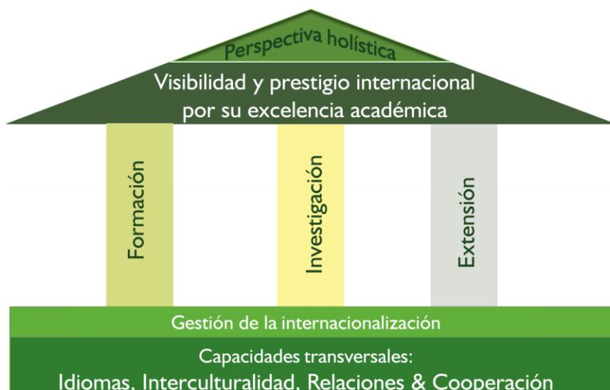
Figura 1. Esquema de Internacionalización en la Universidad Industrial de Santander

En términos específicos, en una primera parte, los lineamientos que se plantean en el presente documento están ligados a los ejes misionales de la Universidad, formación, investigación y extensión, aparentemente distinguibles, pero con muchos elementos comunes y con una función integradora o articuladora, como lo es la investigación, así se ilustra en la figura 2.