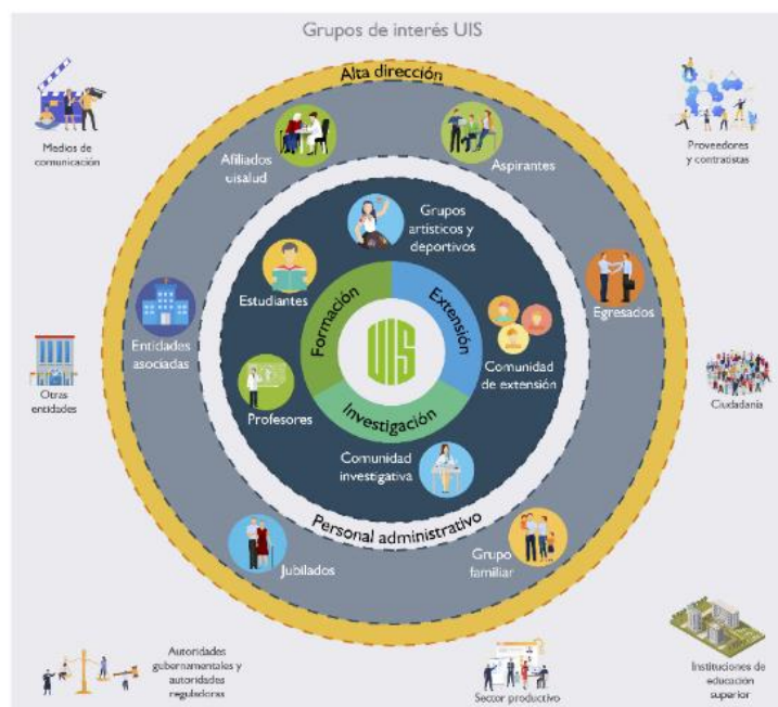
Figura 6. Actores de la internacionalización en la UIS tomado del Manual de Gestión Integrado, grupos de interés de la Universidad.