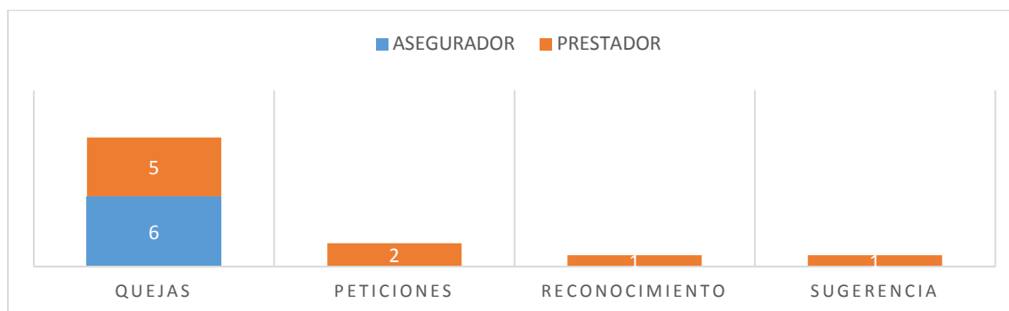
Figura 2. Distribución de PQRSR según rol prestador y asegurador UISALUD.